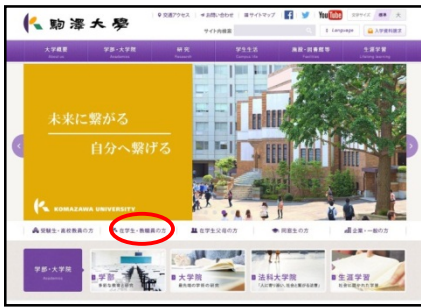
大学HP「在学生・教職員」ページ下部 リンク「C-Learning (学生用)」